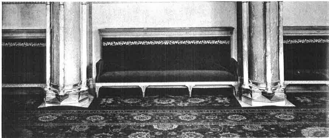
A főrendiház társalgó-csarnokának részlete.

Steindl Imre az Országház megtervezésekor szimmetrikus épületet alkotott meg. Ennek központjából, a kupolatérből indul két nagy Társalgó az Üléstermekhez. A Társalgók múmárvány-burkolatos terek, freskókkal, színes üvegablakokkal. A falak mentén mindkét oldalukon 5-5 ülőfülkével. Mellettük oszlopos konzolokon szobrok állnak. A terekben két-két díszes kandaláber kapott helyet, melyek körül bordó bársonnyal kárpitozott ülőpad van. A padlót kézi csomózású szőnyeg fedi, amely a termek teljes hosszában az ajtóig, illetve az ülőfülkékig ér. A két Társalgó szőnyegének azonos a motívum világa, de a színük más. Az ülőfülkékbe 10-10 kis szőnyeget helyeztek el.